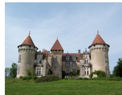
Le Château de la Filolie